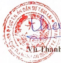
Vũ Thành Sơn